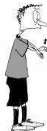
903 Dvigovanje naspr. palice (dlani obrnjene navzgor)