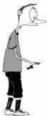
920 Igra z roko (dlan navzgor)