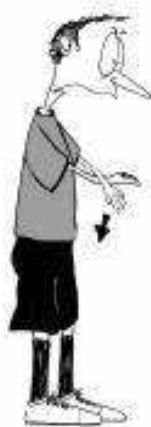
902 Zadrževanje naspr. palice (dlani obrnjene navzdol)