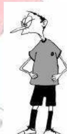
925 Neprimerno obnašanje