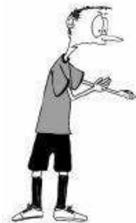
901 Udarec po palici