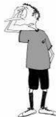
921 Igranje z glavo (dlan na čelo)