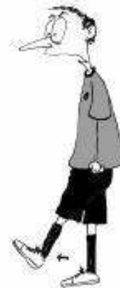
912 Podaja z nogo (do višine gležnjev)