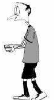
917 Nepravilna prosta podaja (roki vzporedno)