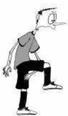
905 Postavitev palice, stopala ali noge med nasprotnikovi nogi (dlan navzgor)