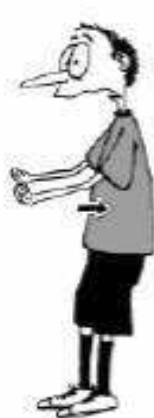
908 Nepravilno pomikanje nazaj (dlani v obliki skodelice, navzgor)