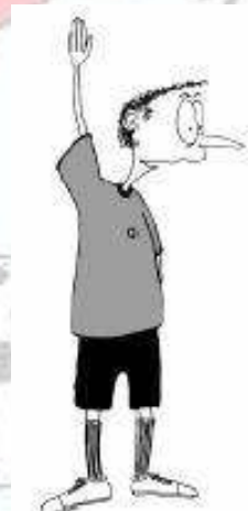
807 Kazen z zamudo/ kaz. strel z zamudo (roka navpično, dlan naprej)