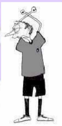
806 Kazenski strel