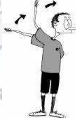
918 Nepravilno izvajanje prostega strela (vlečni strel) (v nasprotno smer igranja, dlan navzdol)