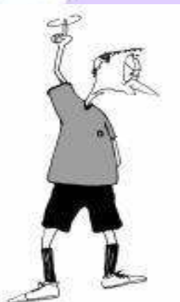
924 Zavlačevanje z igro