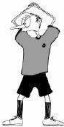
914 Zadrževanje v vratarjevem prostoru