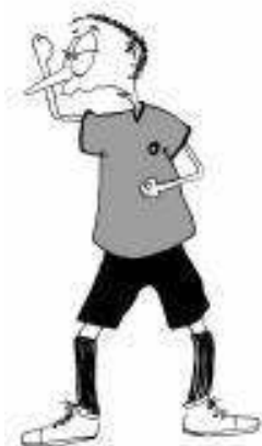
904 Visoka palica (kot držanje palice)