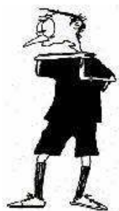
801 Odmor 30 sek. (prsti pravokotno na dlan)