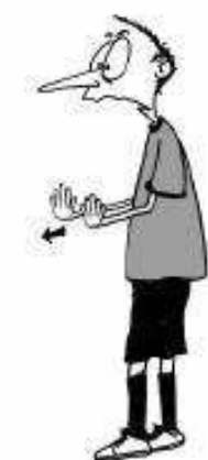
907 Nepravilno potiskanje (lahko se pokaže le z eno roko)