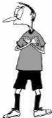
911 Nepravilno oviranje