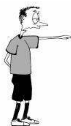
803 Žogica izven igrišča 804 Prosti strel (roka v smeri igre, dlan navzdol)