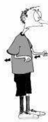
906 Vlečenje (pesti vzporedno)