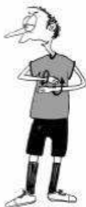
922 Nepravilna menjava (roki rotirata)