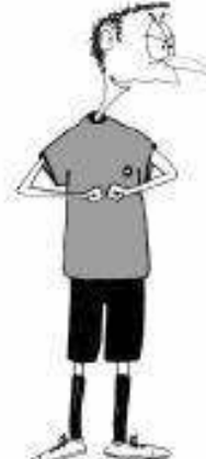
909 Grobost (pesti)