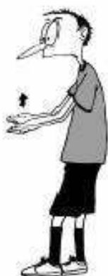
916 Nepravilen skok (dlani navzgor)