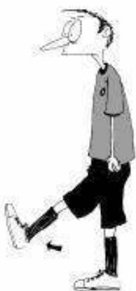
913 Igranje s previsoko dvignjeno nogo (do višine kolena)