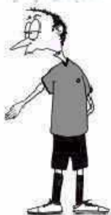
805 Prednost (roka v smer igre, dlan navzgor)