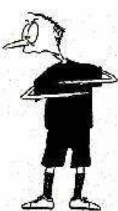
802 Buli (roki vzporedno, dlani navzdol)