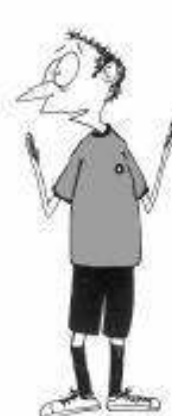
915 Nepravilna razdalja (roki navzgor)